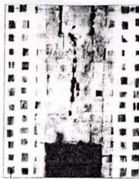
« Entre le tumulte des pierres » par Pen'du (Galerie de Menthon).

A 34 ans, l'artiste dont nous avons souligné dans le passé le talent prometteur est en train d'affirmer un talent personnel dégagé des influences. Si la silhouette animale et notamment celle du cheval habite toujours son univers, la technique s'est enrichie. L'utilisation du zinc récupéré, utilisé comme support ou comme cadre, du bois brut rapporté, des rectangles de toile peints appliqués et intégrés à la toile, confèrent à ces œuvres, en dépit de leur pauvreté, une étonnante richesse.