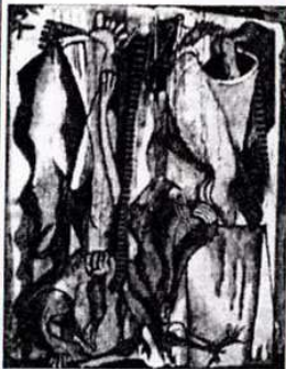
« Le pin brûlé »

A 22 ans seulement, l'artiste fait preuve d'une étonnante maturité. Elle s'est déjà créé un univers personnel dans lequel les humains et les objets s'entrecroisent de manière très structurée. Les tonalités chaudes, mais appliquées sans aucune gratuité ni recherche de l'effet, apportent à cette comédie humaine une bouffée de tendresse. Cela n'empêche pas le peintre de faire souvent preuve d'un humour discret. Les qualités graphiques sont évidentes au point que certaines des œuvres exposées pourraient faire l'objet de très beaux cartons de tapisserie. Cette première exposition personnelle constitue une vraie révélation.