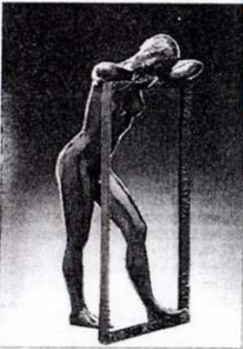
« L'amour de la peinture », par Coquillay (Art France).

Monumentales sont les estampes de ce magnifique artiste suisse de 60 ans, inter-