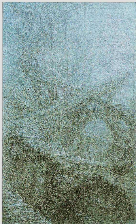
"URBS II", 2000, 26 x 43 cm, Epreuve rehaussée d'une des 15 gravures prévues pour URBS ou Points de vue sur l'idée de perspective.