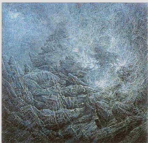
"L'écume", 1997, 27,5 x 27,5 cm, Epreuve rehaussée de l'avant-dernier état.

me landscapes are impregnated with mystery. He has studied the aura of Notre Dame and the tip of the Ile Saint-Louis bathed in light during a break in cloud cover, the different tones telling the tale of the battle between light and shade. Mathieux-Marie's work helps unveil the magic surrounding the difficult discipline of etching. ■